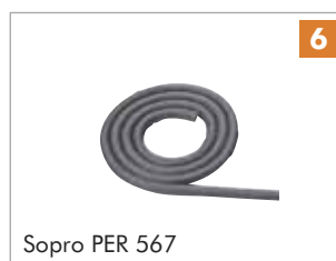
Sopro PER 567