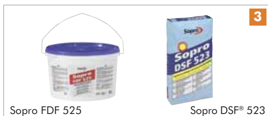
Sopro FDF 525