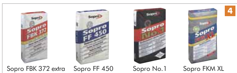
Sopro FBK 372 extra