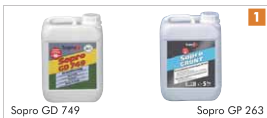
Sopro GD 749