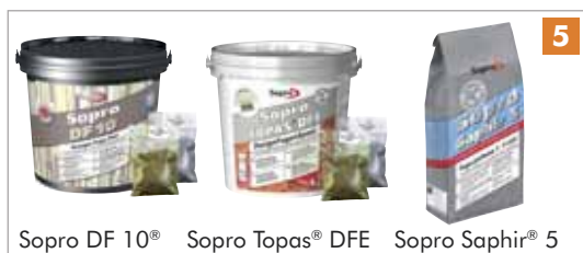
Sopro DF 10®